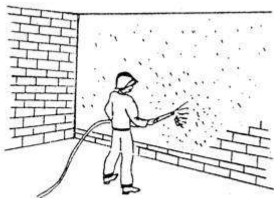
Не допускать перегибов, острых углов и петель растворопроводов.

Не оставлять без надзора форсунку растворопровода, находящегося под давлением.